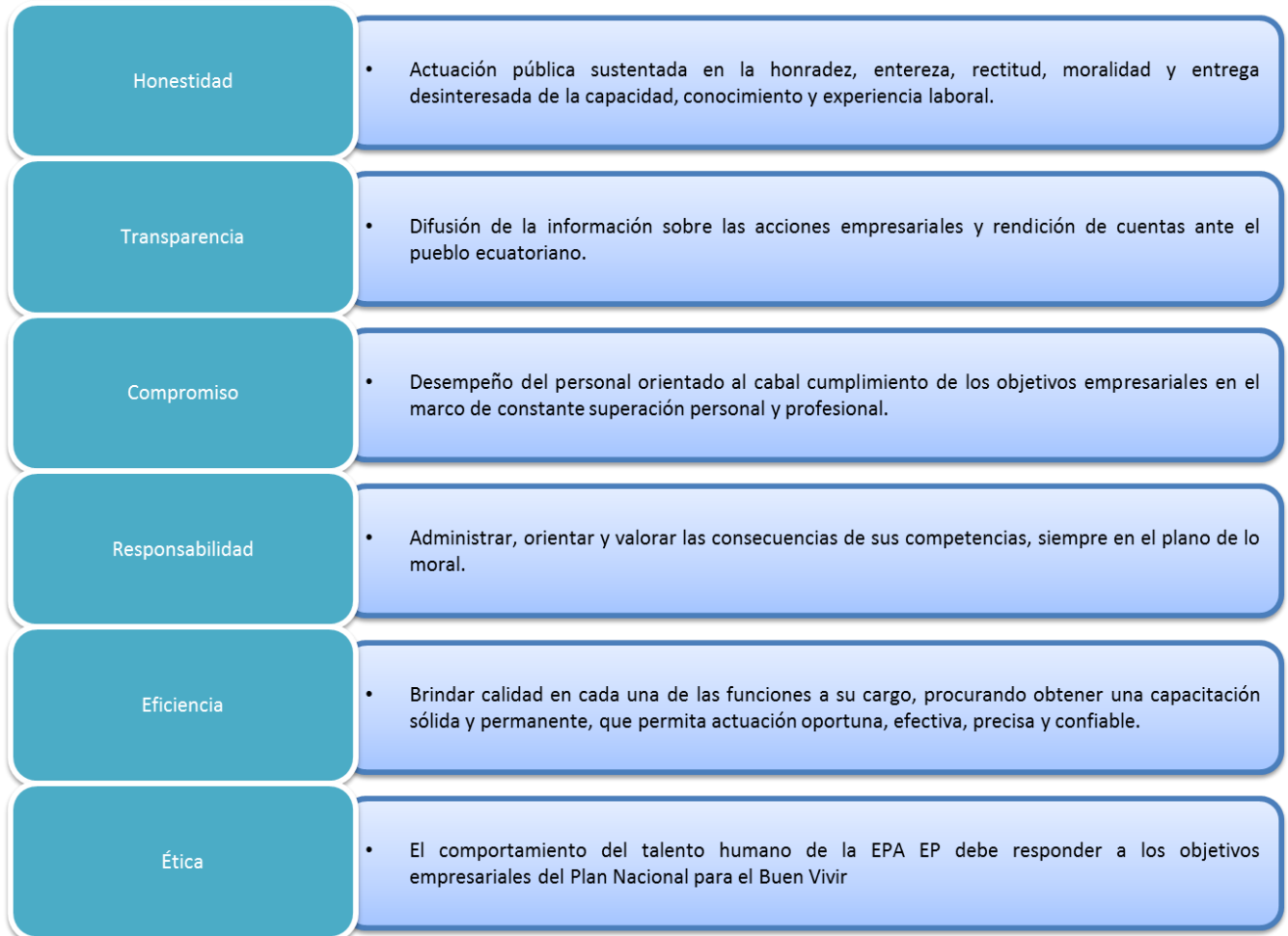
Ilustración 1.- Valores Empresariales

Elaborado por: Dirección de Planificación, Inversión y Seguimiento.